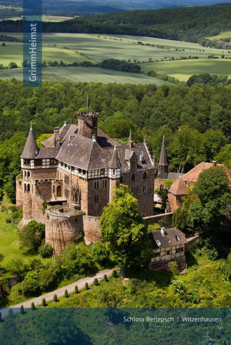
Schloss Berlepsch | Witzenhausen

Die Natur ist nie hektisch, alles ist immer im Fluss. Die Arbeitswelt wird jedoch immer hektischer. Wer allerdings seinen Arbeitsplatz und seine Aufgaben mitgestalten kann, wer Visionen hat und wer mitdenkt und vorausschauend handelt, hat am Ende des Tages keinen Stress gehabt, sondern etwas Großartiges geschaffen: Kundenzufriedenheit.