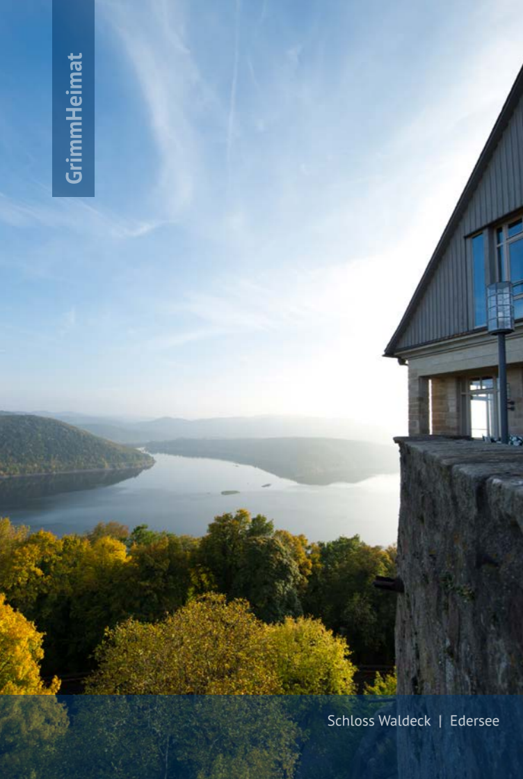
Schloss Waldeck | Edersee

...und unsere Heimat ist NordHessen. Für viele jetzt noch bekannter durch die Bezeichnung „GrimmHeimat“ nach den Brüdern Grimm, die mit ihren Geschichten und Abenteuern noch heute Menschen jeden Alters verzaubern, beglücken und inspirieren. In dieser Heimat leben und arbeiten wir und fühlen uns wohl.